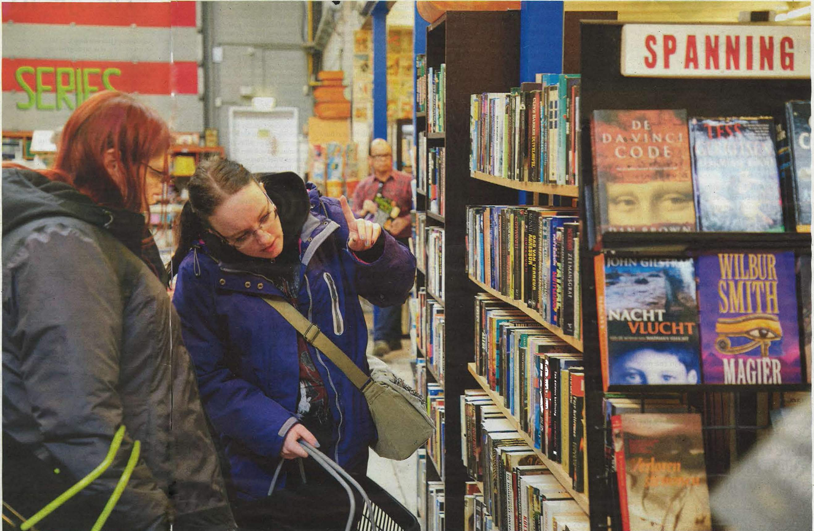
Boeken zoeken bij de kringloop. De tweedehandsboekenmarkt doet de waarde van het boek verminderen.